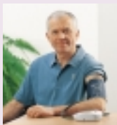
Position à adopter pour la mesure avec appareil au bras.